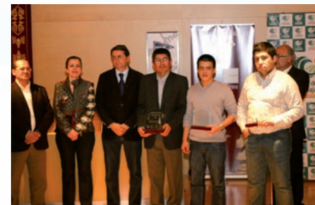
Los tres primeros clasificados del torneo 2010

- La participación en el torneo significa la total aceptación de las bases.