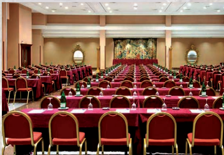
Salón de juego para el torneo 2011

El pago de la cuota se hará efectiva de 9:00 h. a 9:45 h. el día del torneo, en el mismo local de juego.